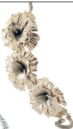
Maxicolar da Abi Project (R$ 989)