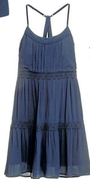
Vestido da Riachuelo (R$ 99,90)

Se o preto básico for sem manga, complemente-o com uma camisa de gola alta branca para arrematar um estilo romântico