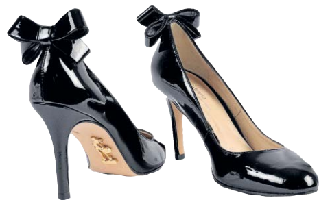
Escarpin clássico da Confraria (R$ 398)

● Nos pés, o salto não é obrigatório. Apenas se o código de vestimenta da festa exigir. Caso contrário, Clarice e Lu concordam que o conforto é prioridade. Saltos mais baixos, anabelas, flatforms e até rasteiras entram na festa.