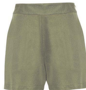
Shorts da Água de Coco (R$ 149)