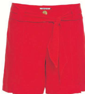
Shorts da Pusco (R$ 315)

● Shorts e jeans podem fazer parte do Natal também. Clarice indica, contudo, modelos de shorts em alfaiataria e jeans com lavagens mais uniformes e cortes mais retos para combinar com o clima da comemoração.