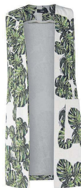
Colete da Lódice (R$ 1.318)