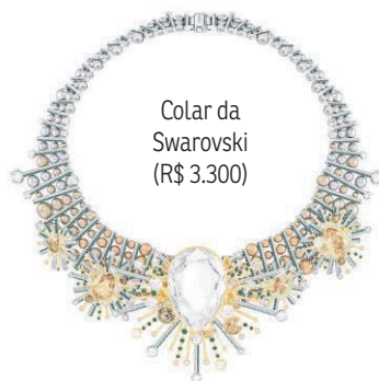
Colar da Swarovski (R$ 3.300)

● Bolsas menores, como as clutchs, são perfeitas para o Natal. Mais arrumadas, são pequenas e práticas para a noite.