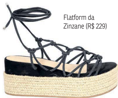
Platform da Zinzane (R$ 229)