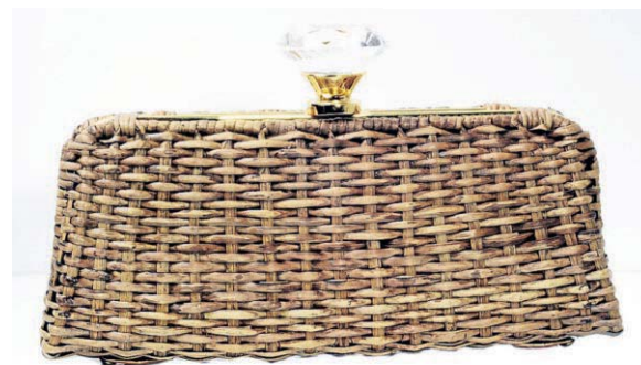
Clutch da Confraria (R$ 1.326)