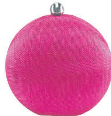
Clutch da Isla (R$ 689)

● Bolsas menores, como as clutchs, são perfeitas para o Natal. Mais arrumadas, são pequenas e práticas para a noite.