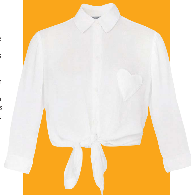
Camisa com nó da ESC (R$ 418)

Camisa branca com saia mídi rodada não se limita apenas a looks de trabalho: arremate-a com um nó e coloque um escarpin clássico para a festa