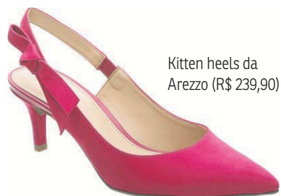
Kitten heels da Arezzo (R$ 239,90)

● Shorts e jeans podem fazer parte do Natal também. Clarice indica, contudo, modelos de shorts em alfaiataria e jeans com lavagens mais uniformes e cortes mais retos para combinar com o clima da comemoração.