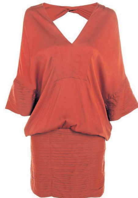
Vestido da Rosa Chá (R$ 1.798)

Usar vermelho no Natal é de praxe, mas não regra. A aposta deste ano é repaginar o look avermelhado tradicional acrescentando outras cores. Lu indica algumas combinações para diferentes estilos. Para as mais elegantes, um look monocromático vermelho com sapatos nude é assertivo e sofisticado. Para as românticas, o vermelho pode vir combinando com cores análogas, como rosa, laranja e roxo. Às criativas, que gostam de ousar, o jeito é fazer um color blocking: vermelho com turquesa ou verde-esmeralda são opções atuais e supercoloridas.